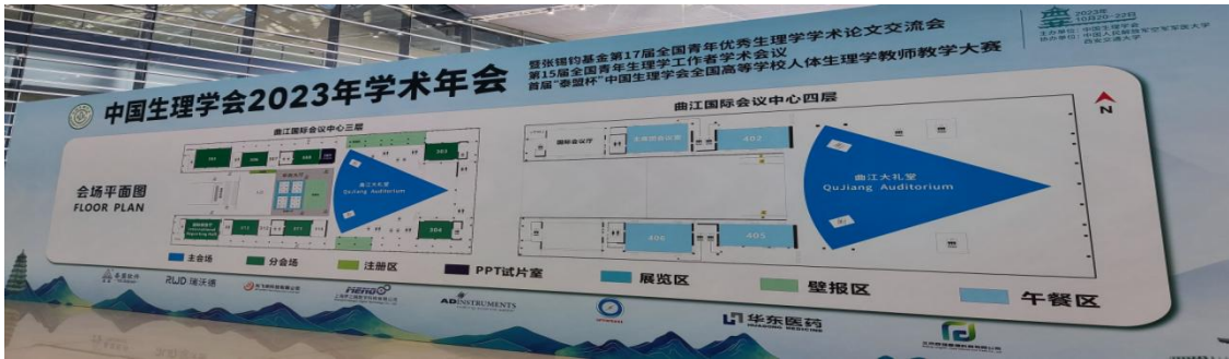
3、室外场馆入口处欢迎牌（喷绘布）：RMB20,000 元（限 3 名）